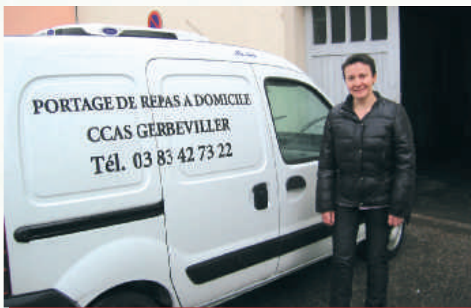
Le nouveau véhicule du CCAS

Des aides financières du Conseil Général sont possibles en fonction des revenus.