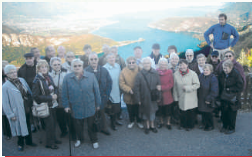
Les seniors en Savoie

Is sont partis à trente à la découverte de la Savoie, ils sont revenus enchantés... Il faut dire que la Savoie sous le soleil en plein automne ça vaut le détour. Dans une ambiance qualifiée de conviviale, nos seniors du territoire ont séjourné à quelques kilomètres du Lac d'Annecy, à St Jorioz. Partis de la Mortagne en autocar grand confort, chauffeur et bus n'ont pas quitté nos aînés pour découvrir cette région : Annecy bien sûr, son lac, mais également le col de la Forclaz,