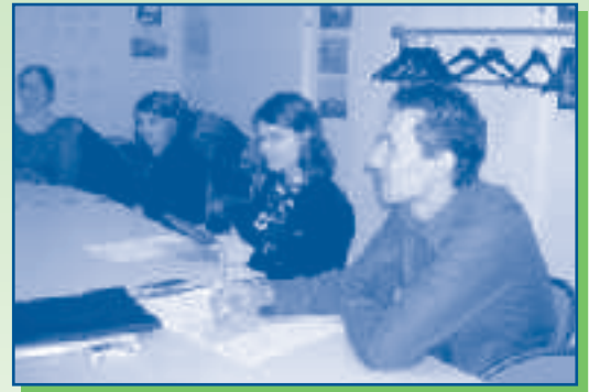
Réunion avec les jeunes de Remeniville le 7 juin 2008

Concernant la communication, il est clairement apparu que des progrès devaient être faits. Pour affiner ce constat, nous vous proposons de compléter et de nous retourner le questionnaire joint à ce bulletin.