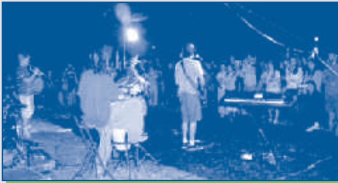
Ras des Pâquerettes en concert le 29 août à Magnières

U ne centaine de jeunes de 12/18 ans a participé à la soirée détente sur l'aire de loisirs de Magnières.