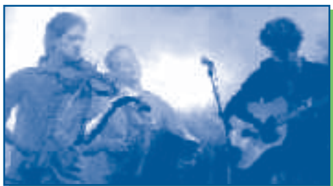
Ambrodzijn, sera en concert à Gerbéviller le 8 novembre

En novembre, la CCM vous propose une animation autour de la Belgique. Pourquoi cette idée ?